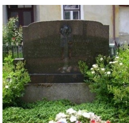
Pomník rumunským vojínům

V obci také ještě letos vznikne v prostorách pomníku padlým v 1. a 2. světové válce jednotné pietní místo . Pomník dostane novou podobu a přesune se sem i pomník rumunským vojínům, stojící u kostela. Tento pomník byl postaven nad skutečným hrobem šesti rumunských vojáků, kteří padli při osvobození obce na sklonku 2. světové války, a byl zachován i po exhumaci jejich ostatků.