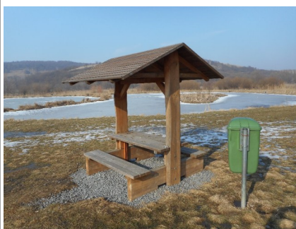
Ilustr. obrázek, foto posezení v Nesovicích