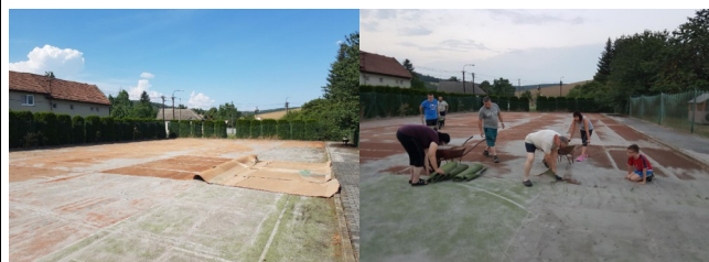
Odstaňování stávajícího povrchu hřiště

Opravu hřiště provádí firma JM Demicar, s.r.o. ze Slavkova u Brna. V průběhu srpna byl za pomoci členů místního Sdružení dobrovolných hasičů odstraněn stávající umělý povrch hřiště. Poté byla odtěžena svrchní vrstva podloží v síle 7 cm a vzniklý prostor byl vyplněn kamenivem dvou velikostních frakcí.